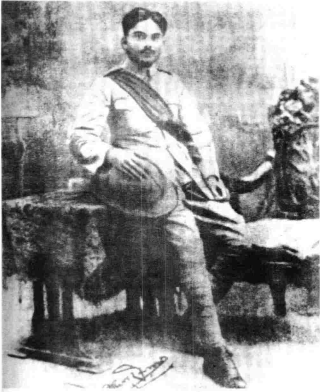
যুদ্ধ- ফেরত নजरুল ইসলাম

‘নजरুল অ্যালবাম’ (অক্টোবর ১৯৯৪), নजरুল ইস্টিটিউট, ঢাকা থেকে সংগৃহীত